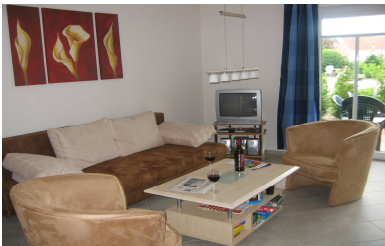
Wohnzimmer Robbie I

Die Ferienwohnungen befinden sich in ruhiger zentraler Lage in Norddeich direkt hin-