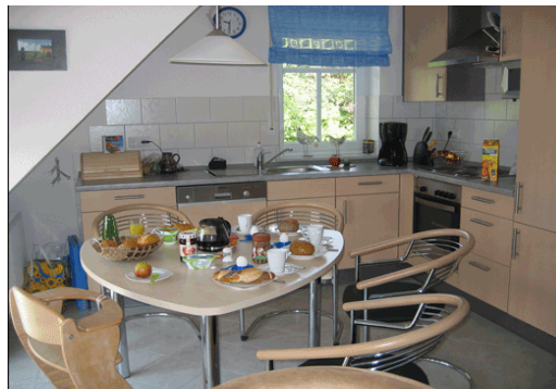
Küche Robbie II

zugleich gemütlich eingerichtet. Sie verfügen entweder über eine Terrasse oder einen Balkon, welche mit Gartenmöbeln ausgestattet sind. Durch die Ausführung mit Fliesenboden und Microfaserbetten ist die Wohnung allergikerfreundlich.