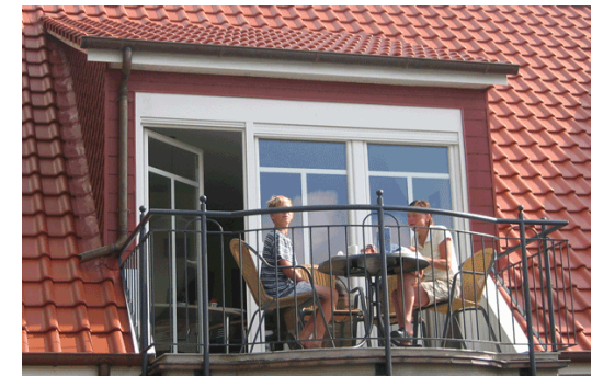
Südbalkon Robbie II