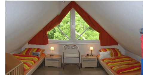
Schlafzimmer Robbie II (DG)